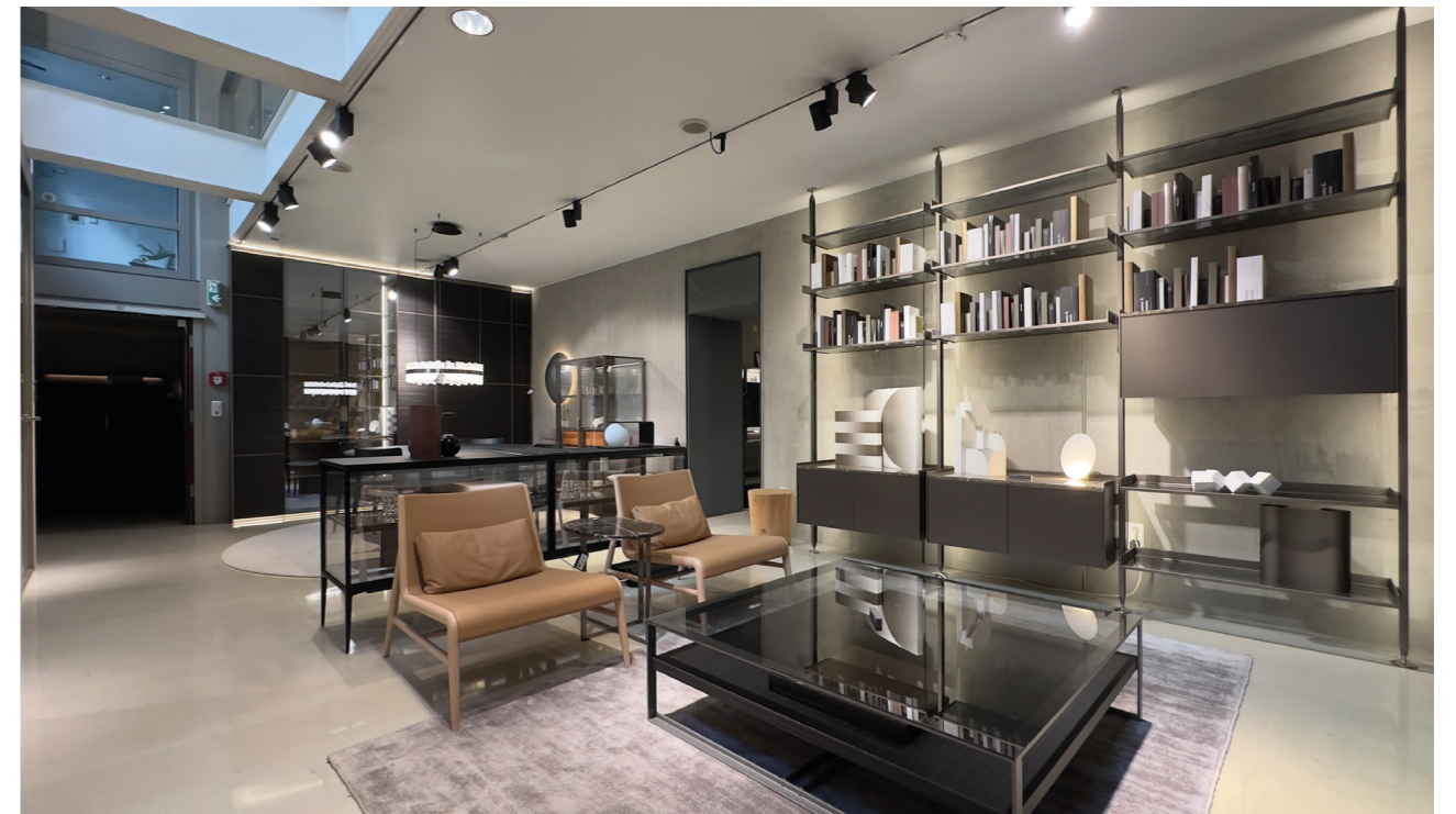
Das imposante Haus Margaretenstraße 93 aus dem Jahr 1886 - 4 Stockwerke mit exklusiven Designmöbeln