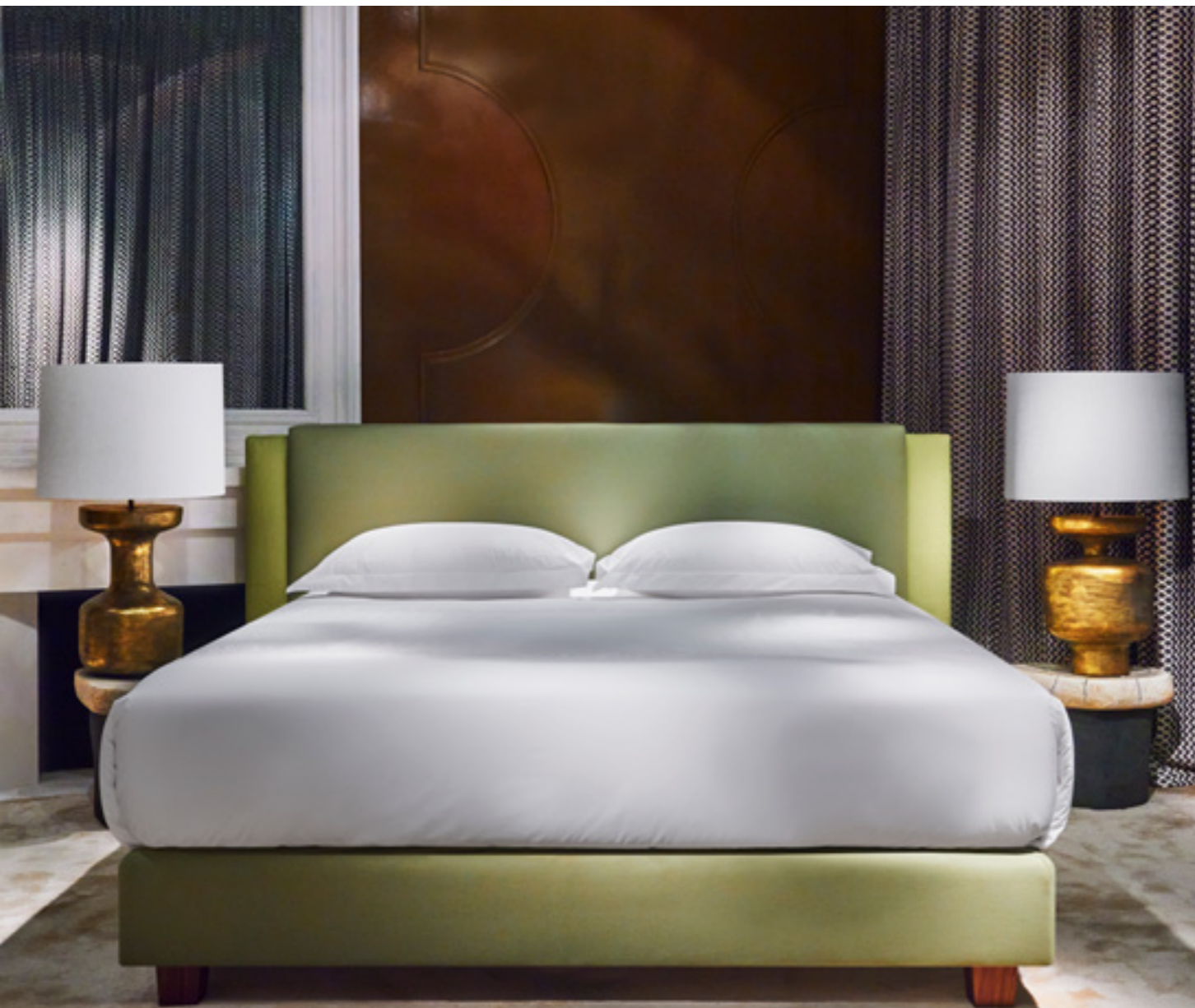
Alezane, Design Charles Tassin