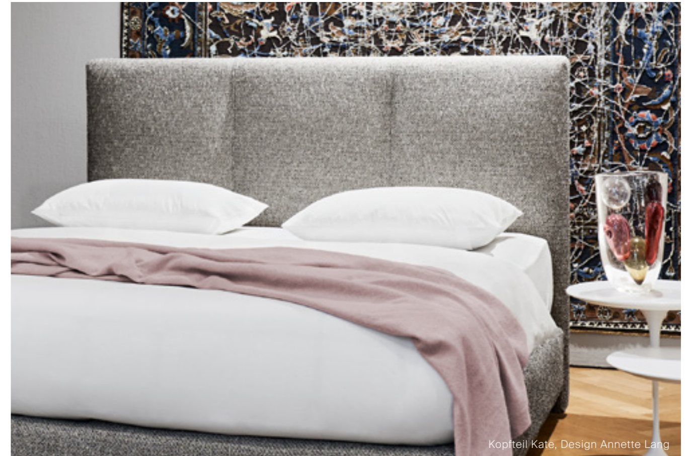
Kopfteil Kate, Design Annette Lang