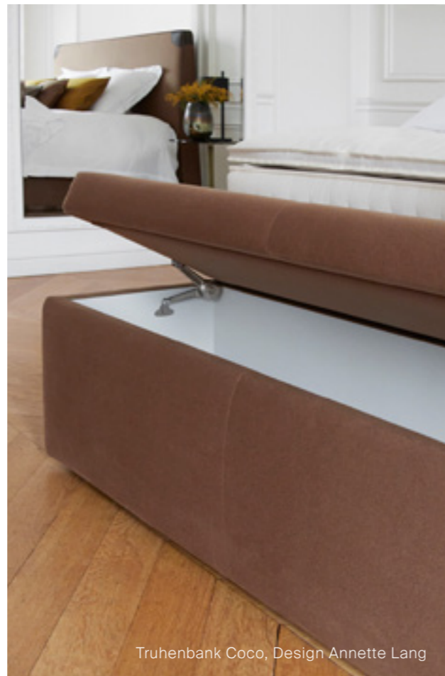
Truhenbank Coco, Design Annette Lang