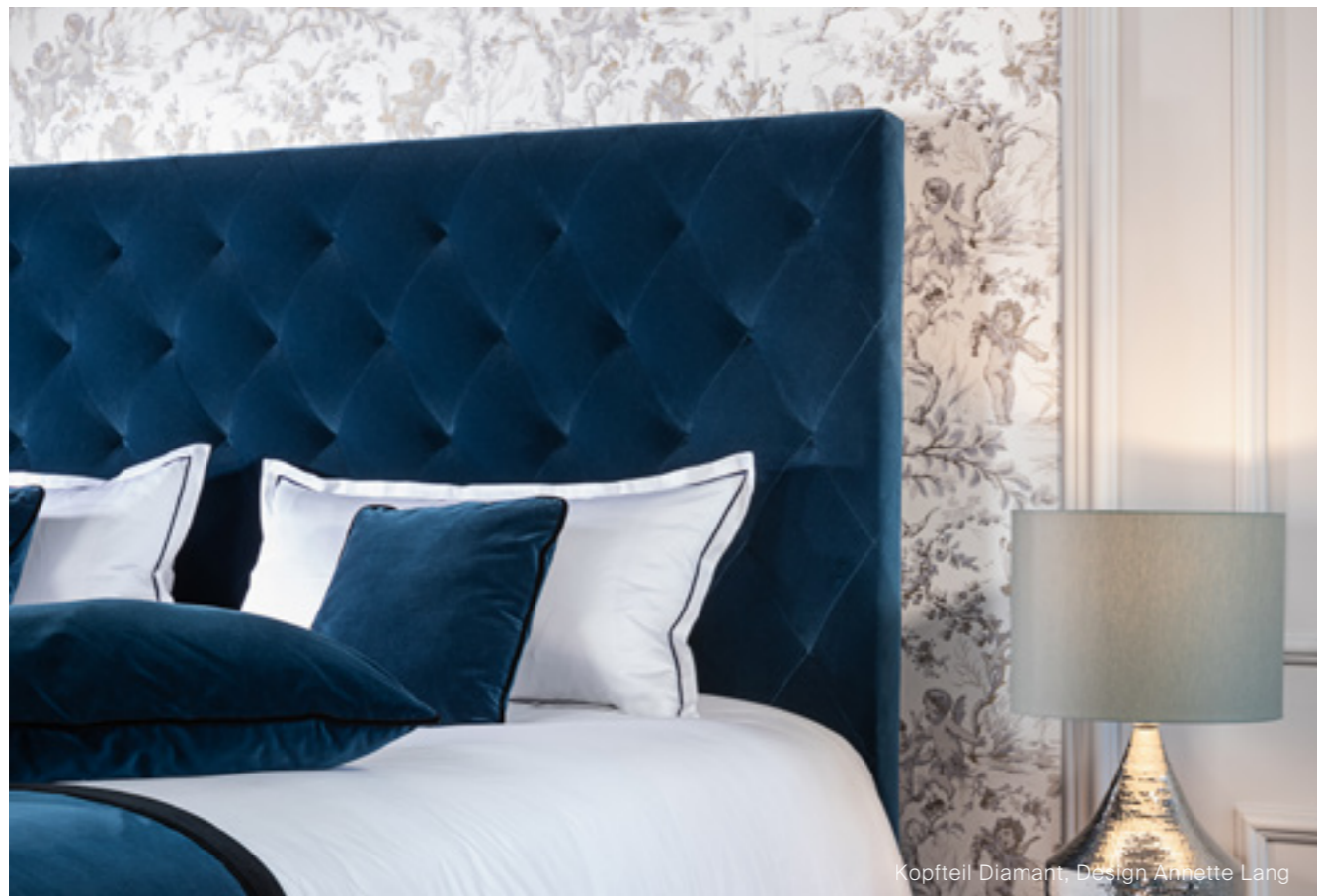
Kopfteil Diamant, Design Annette Lang