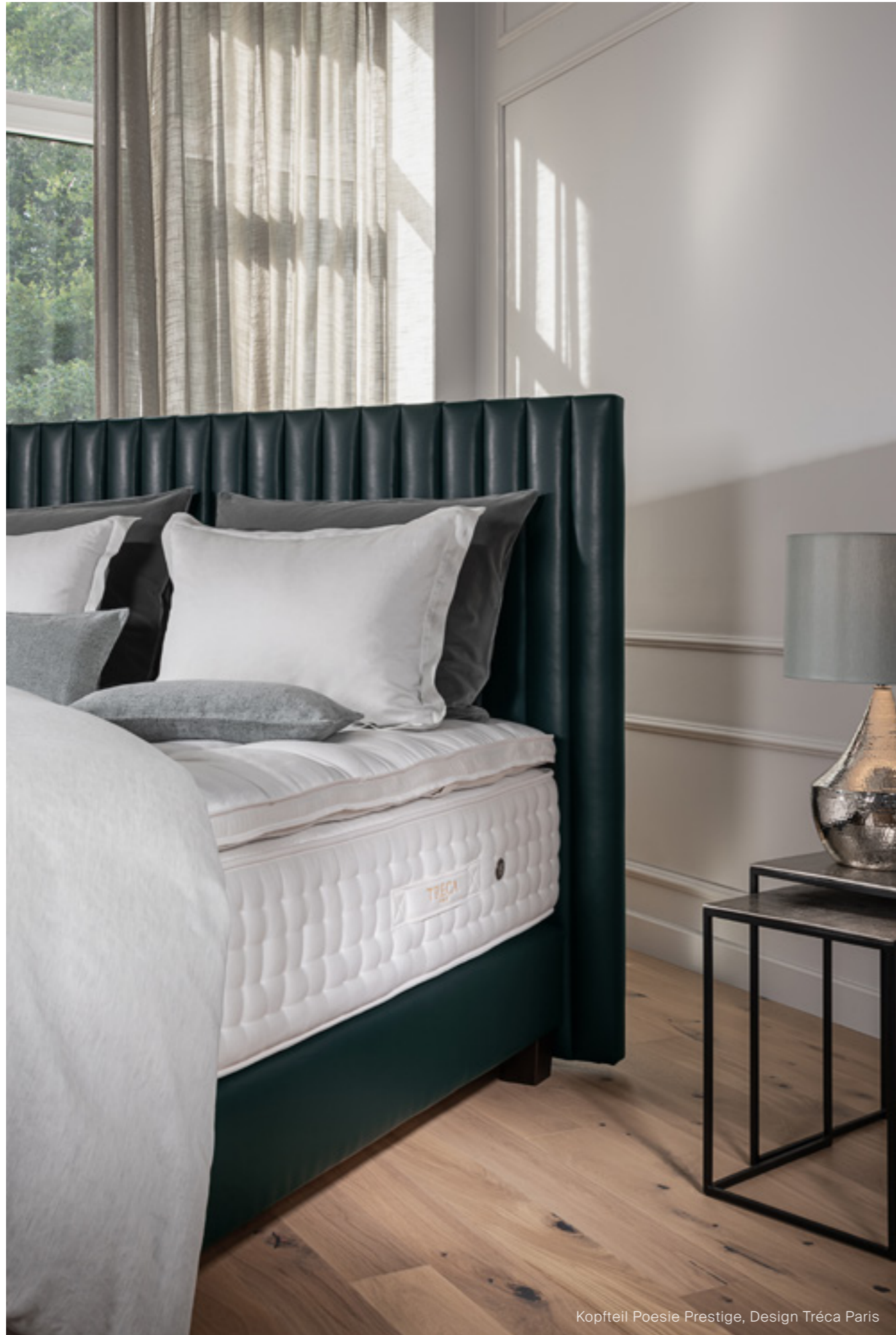
Kopfteil Poesie Prestige, Design Tréca Paris