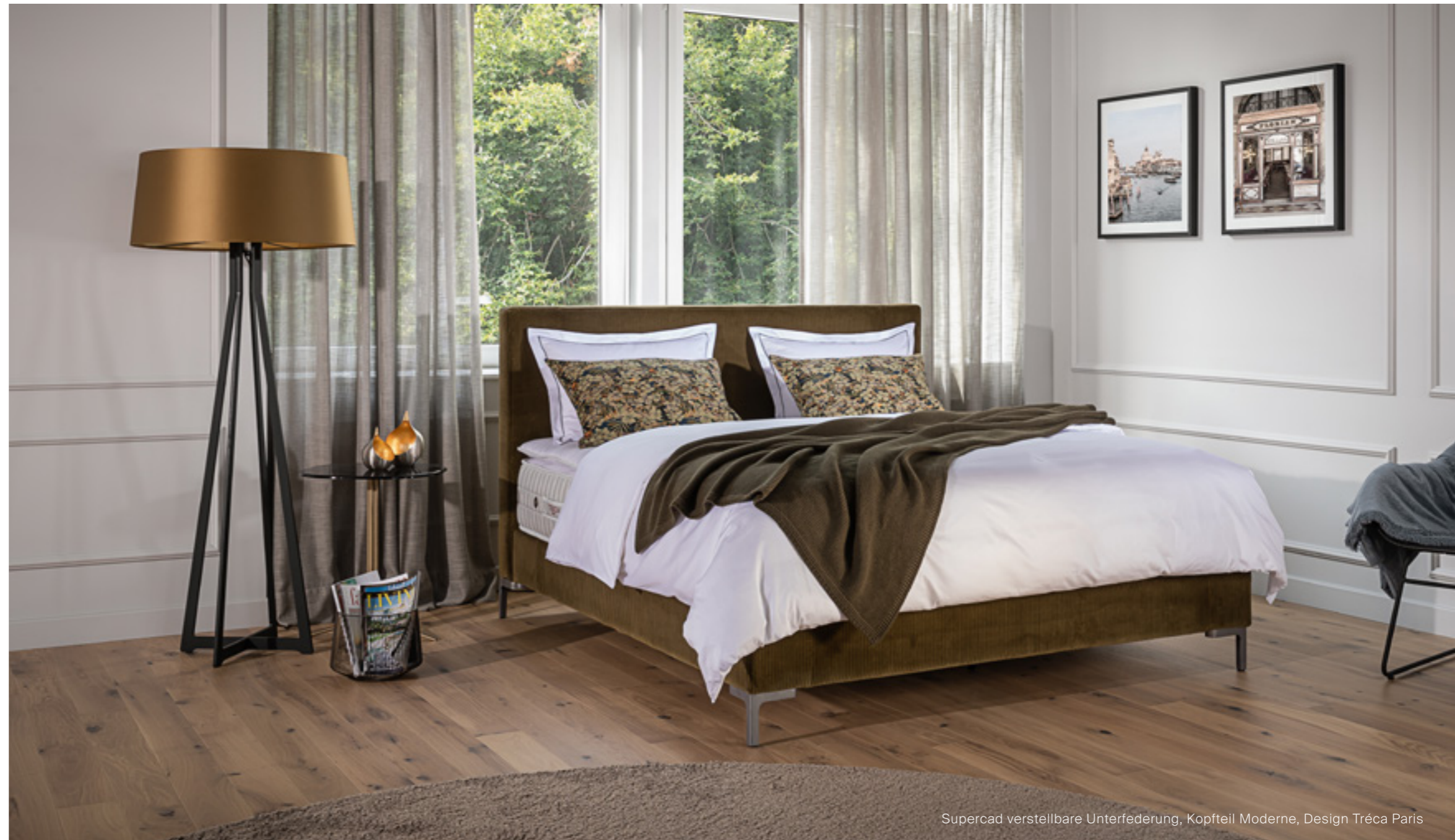
Supercad verstellbare Unterfederung, Kopfteil Moderne, Design Tréca Paris

Scannen Sie den QR-Code und erfahren Sie mehr über unser Know-how bei elektrisch verstellbaren Betten.