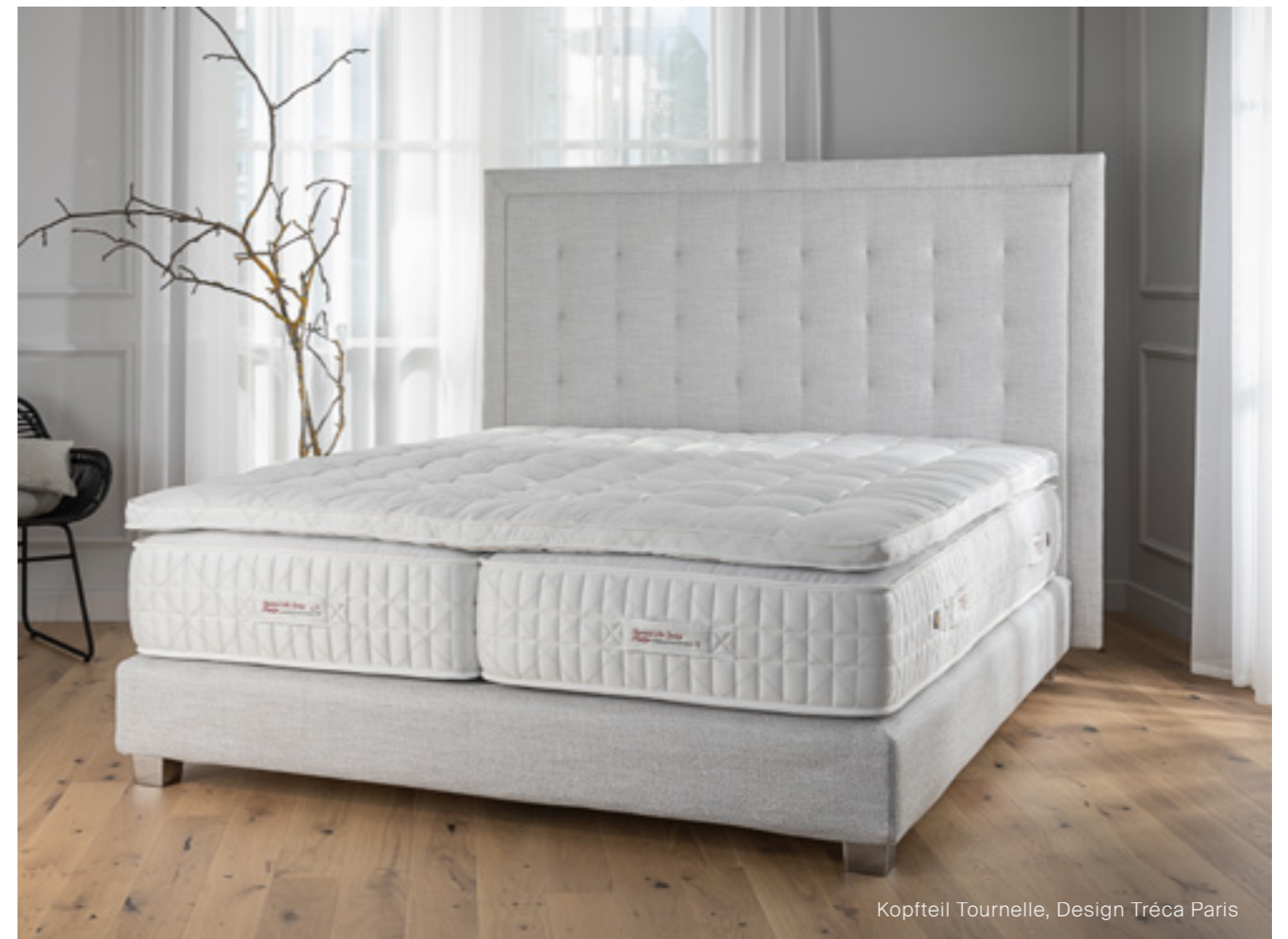
Kopfteil Tournelle, Design Tréca Paris