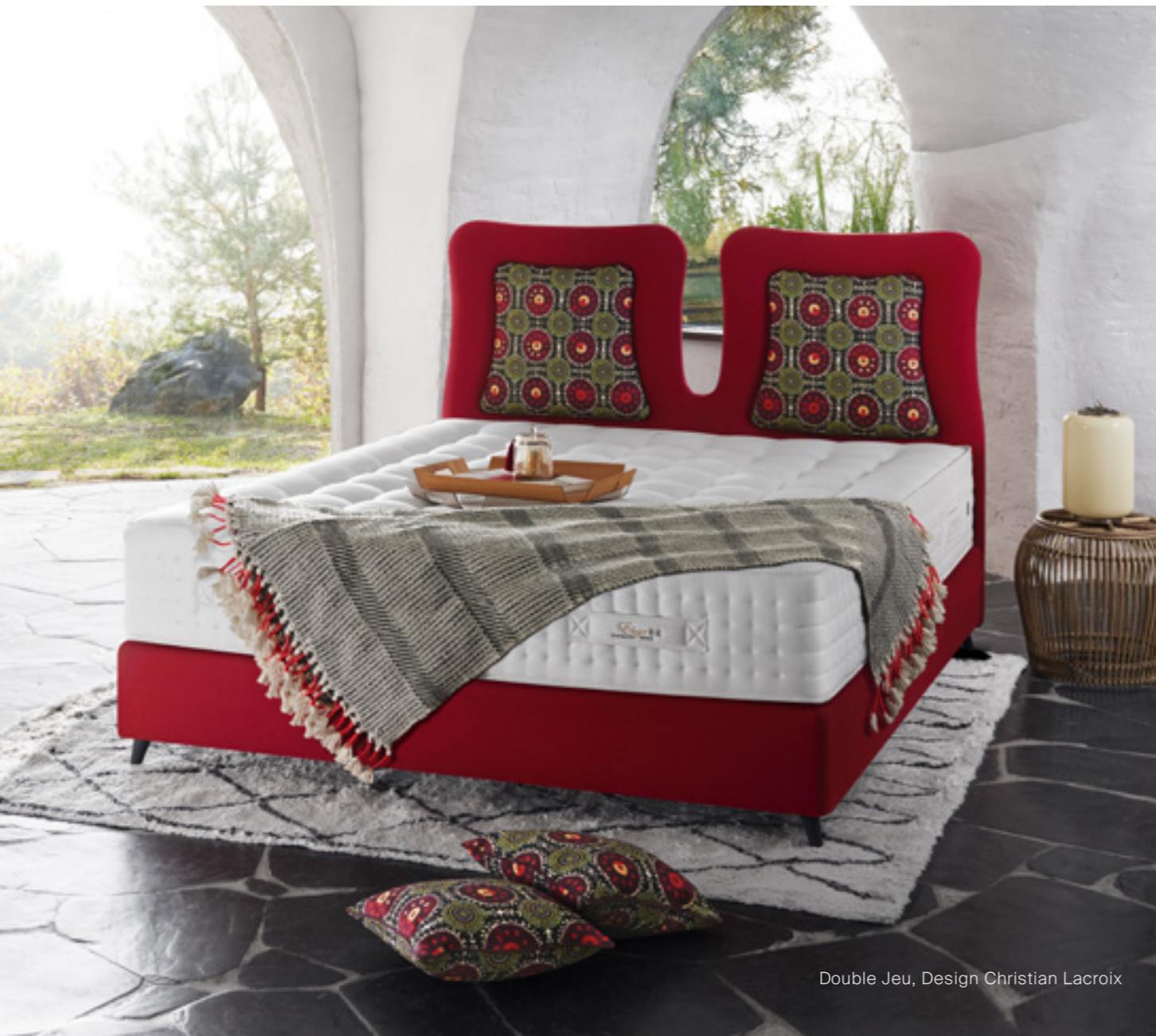
Double Jeu, Design Christian Lacroix