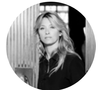
MAISON SARAH LAVOINE M S L

Das Fachwissen von Tréca in Kombination mit dem Know-how von Maison Sarah Lavoine spielt mit verschiedenen Formen und Texturen, um mit Schwung alle Designregeln zu brechen und eine Lebenskunst zu verteidigen, die das Wohlbefinden fördert.