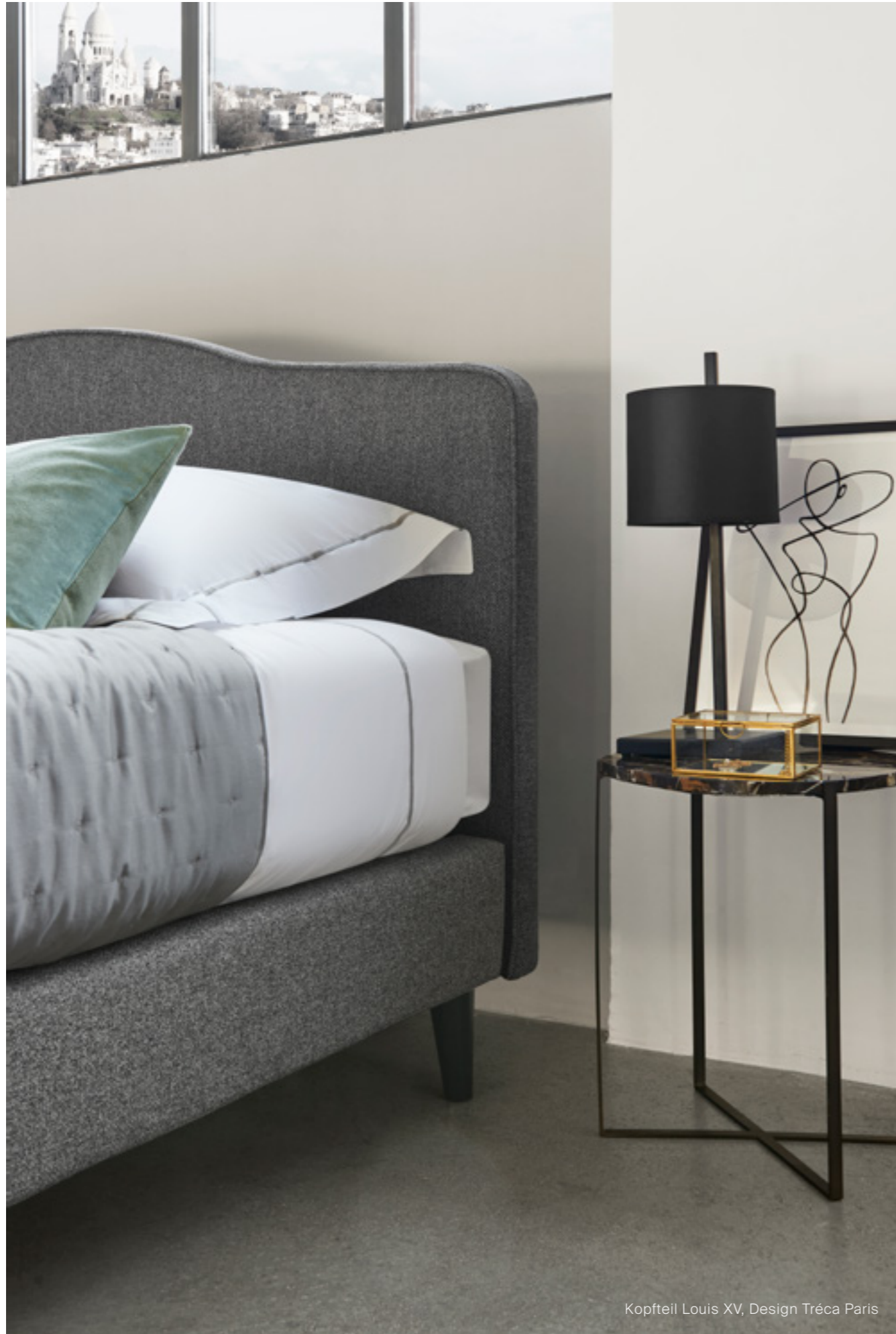
Kopfteil Louis XV, Design Tréca Paris