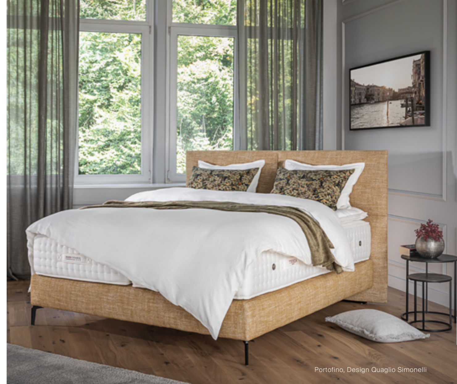
Portofino, Design Quaglio Simonelli