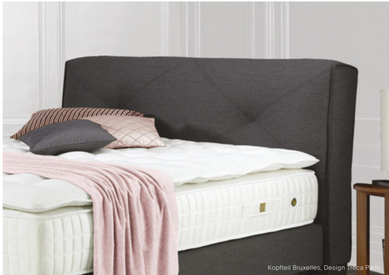
Kopfteil Bruxelles, Design Tréca Paris