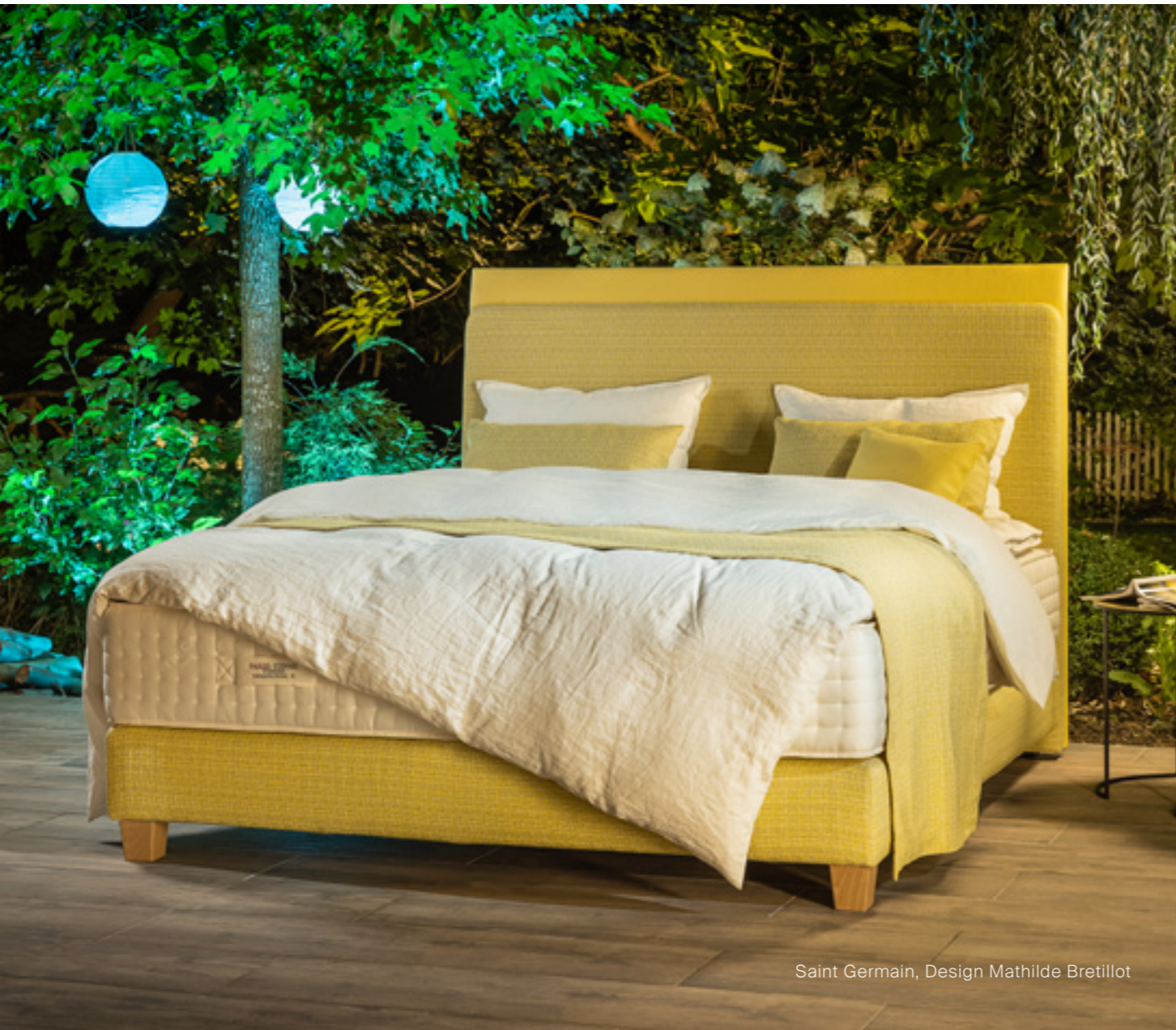
Saint Germain, Design Mathilde Bretillot