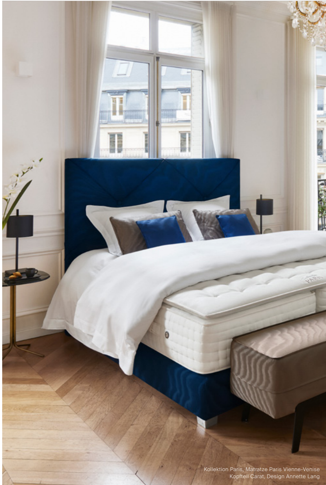
Kollektion Paris, Matratze Paris Vienne-Venise Kopfteil Carat, Design Annette Lang