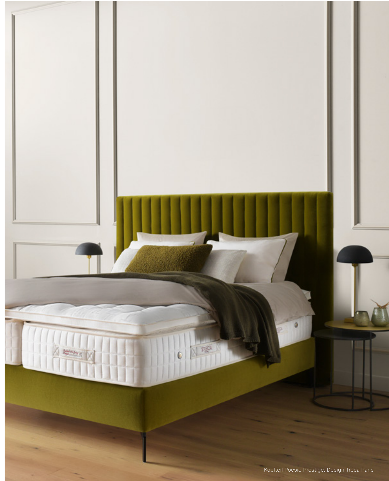
Kopfteil Poésie Prestige, Design Tréca Paris