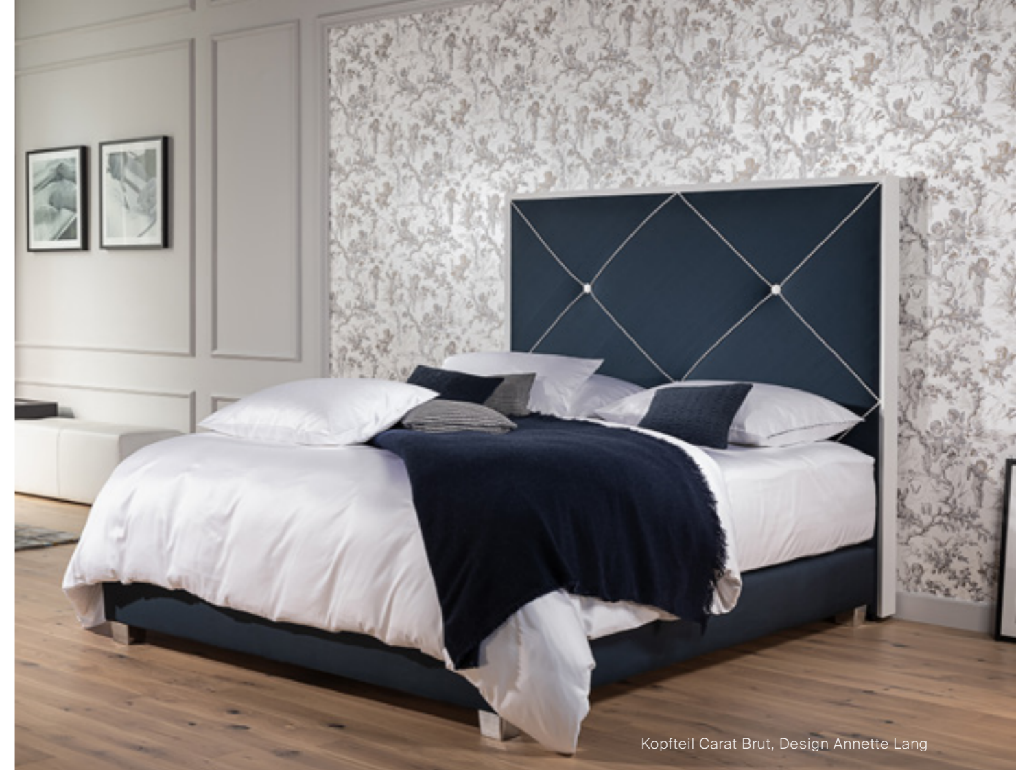
Kopfteil Carat Brut, Design Annette Lang