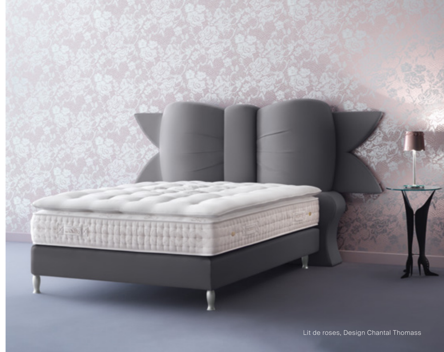
Lit de roses, Design Chantal Thomass