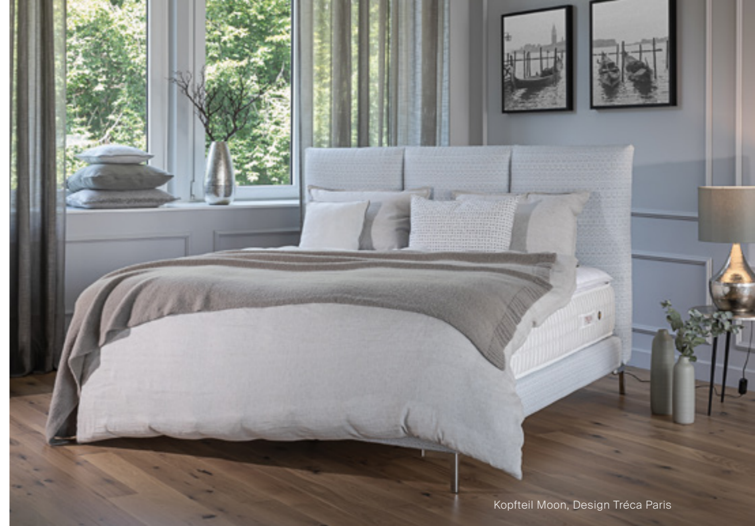
Kopfteil Moon, Design Tréca Paris