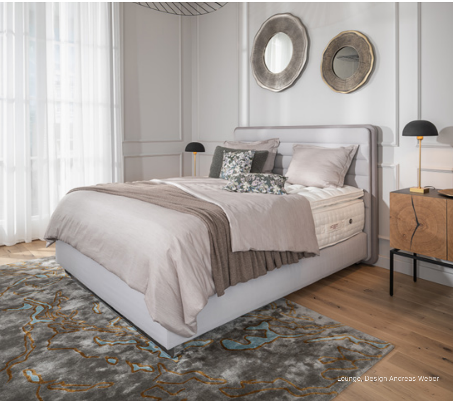
Lounge, Design Andreas Weber