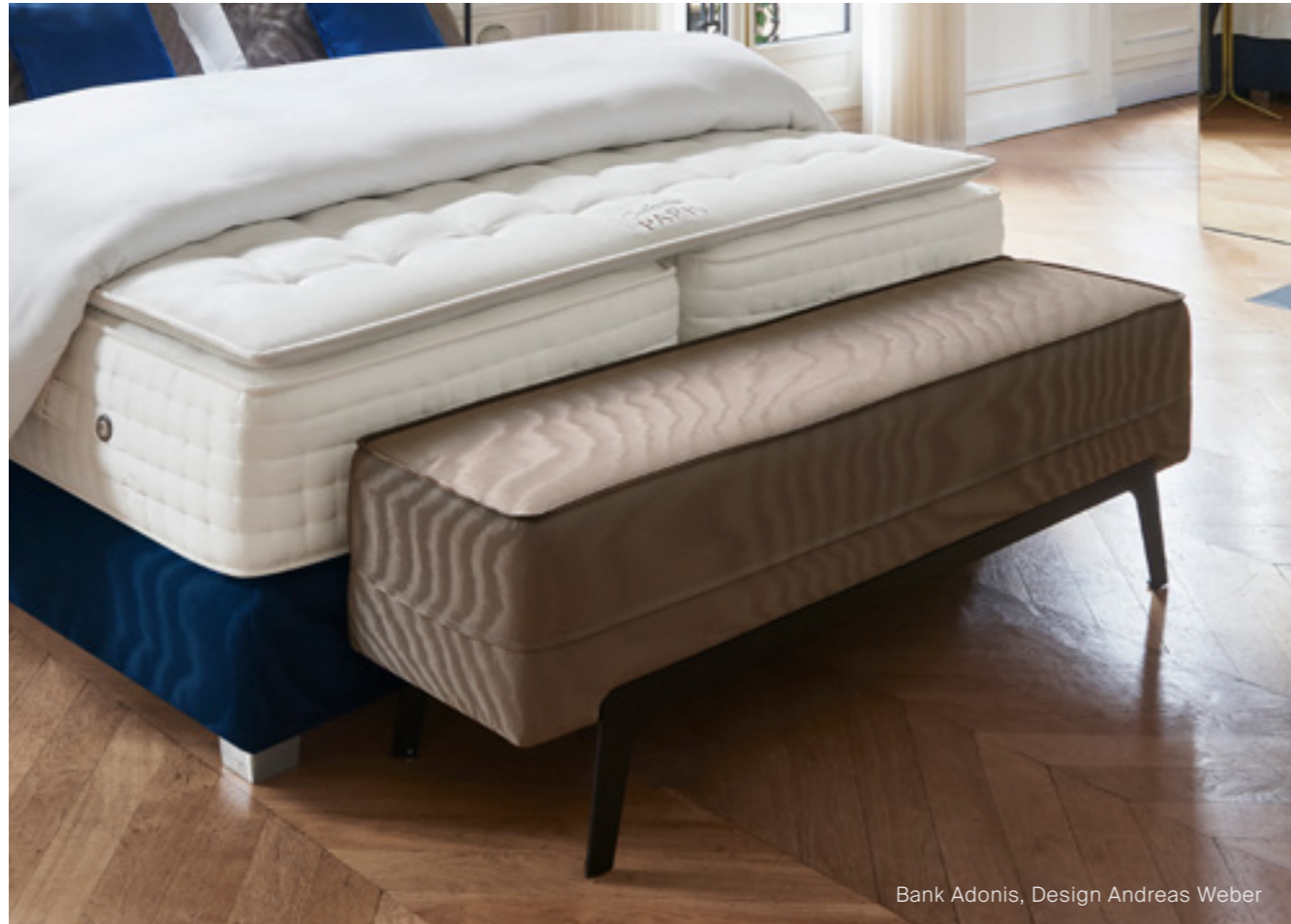
Bank Adonis, Design Andreas Weber