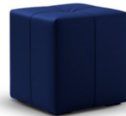
Hocker Coco, Design Annette Lang

Für diejenigen, die ihrer Schlafzimmereinrichtung eine persönliche Note verleihen möchten, bieten unsere Zierkissen, die in zwei Ausführungen (Keder oder Volant) erhältlich sind, und ein Bettläufer die perfekte Lösung. Wählen Sie aus einer Vielzahl von Stoffen, darunter auch aus den Tréca-Stoffmusterbüchern, und passen Sie Ihr Schlafzimmer-Ensemble an Ihren individuellen Geschmack und Ihre Vorlieben an. Mit diesen sorgfältig zusammengestellten Accessoires verwandeln Sie Ihr Schlafzimmer in eine Oase des Komforts und des Stils.