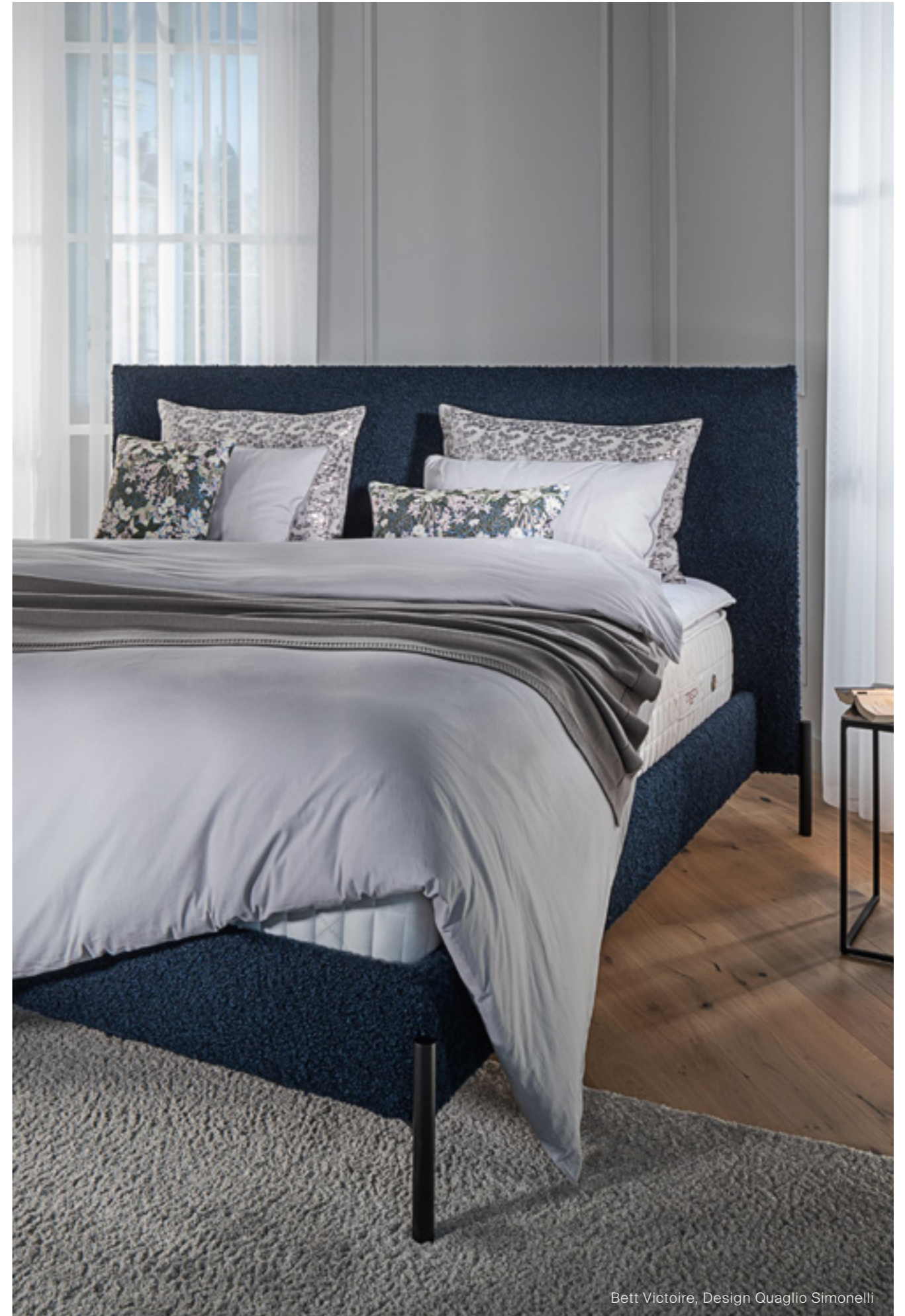
Bett Victoire, Design Quaglio Simonelli