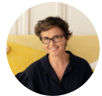
• CONSTANCE GUISET STUDIO

Dieses Kopfteil wird in unserem Atelier in Chambord gefertigt.