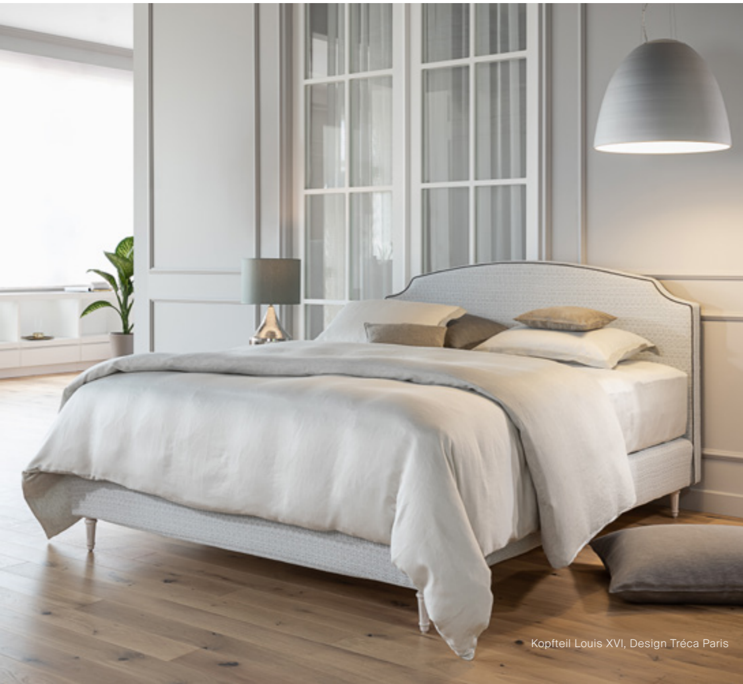
Kopfteil Louis XVI, Design Tréca Paris

Wir schöpfen unsere Kreativität jedoch nicht nur aus unserem eigenen Team. Wir arbeiten zudem mit ausgewählten externen Designer*innen zusammen, um unser Angebot zu bereichern, indem wir ihre unterschiedlichen Perspektiven und ihr Fachwissen einfließen lassen. Durch diese Zusammenarbeit stellen wir sicher, dass jede Kreation, egal ob sie von unserem eigenen Team oder gemeinsam mit eigenständigen Designer*innen entwickelt wurde, der Inbegriff von einem luxuriösen und edlen Bett ist.