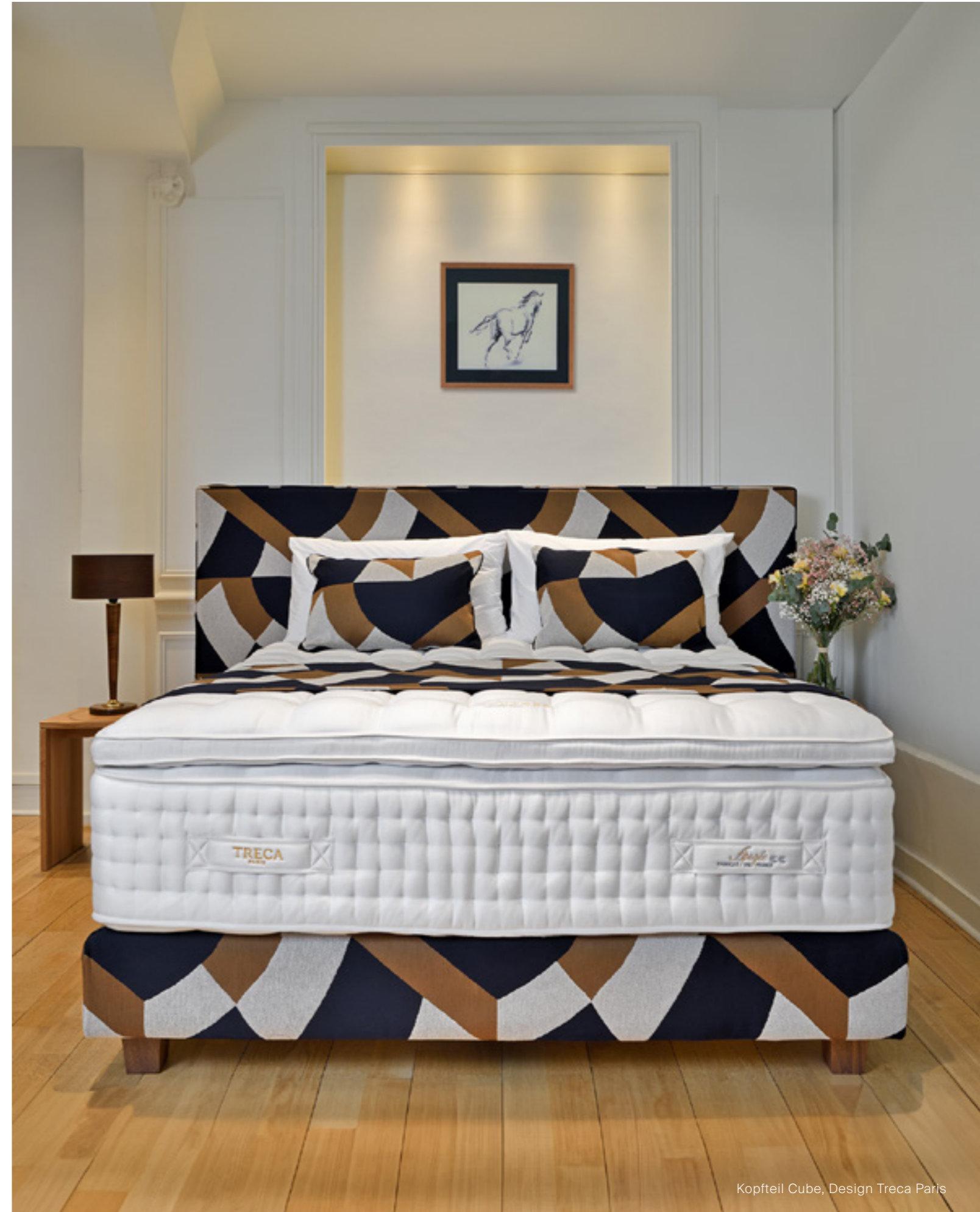
Kopfteil Cube, Design Treca Paris