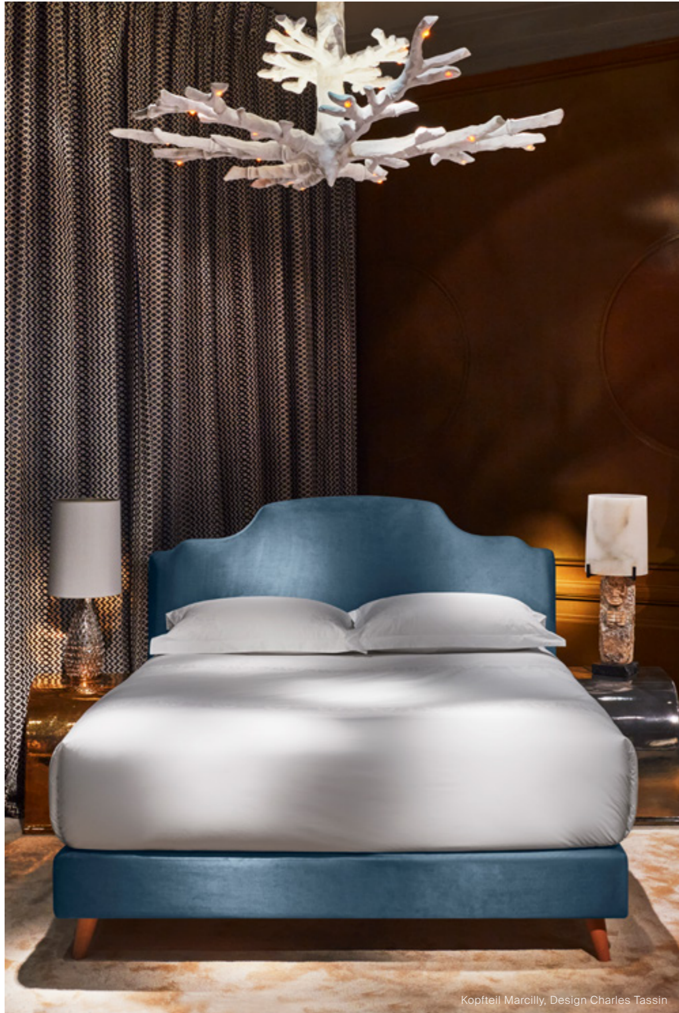
Kopfteil Marcilly, Design Charles Tassin