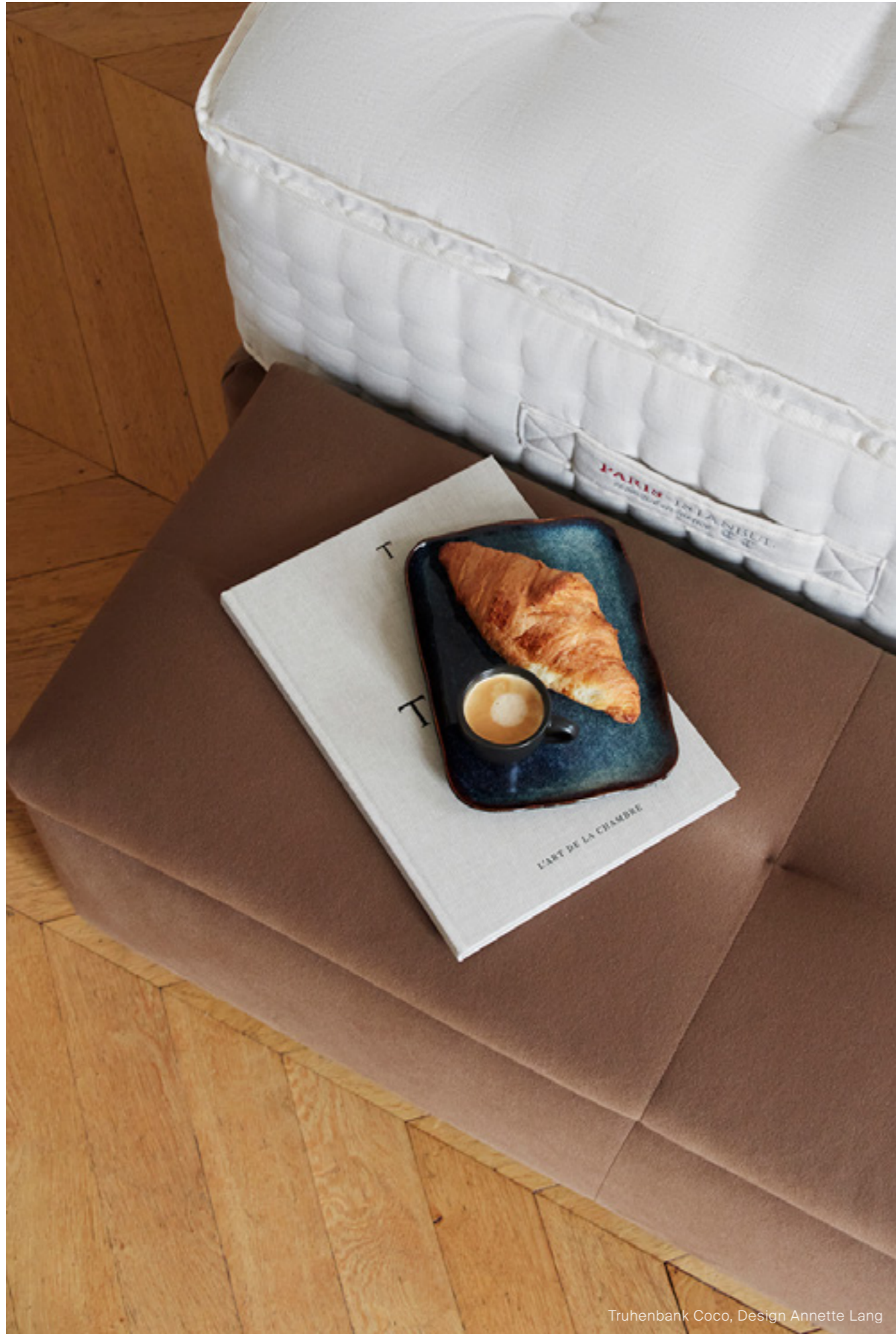
Truhenbank Coco, Design Annette Lang