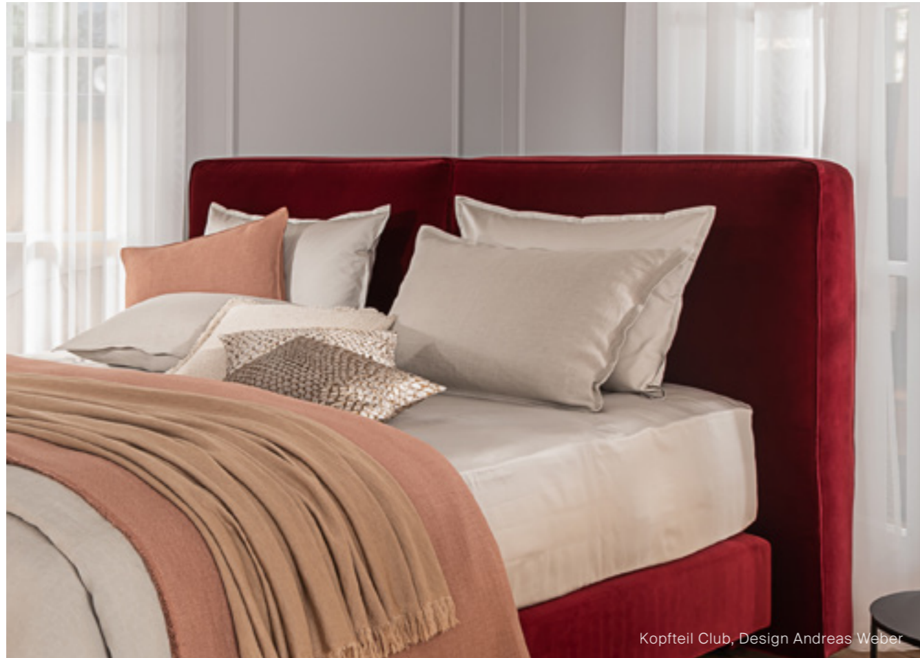
Kopfteil Club, Design Andreas Weber