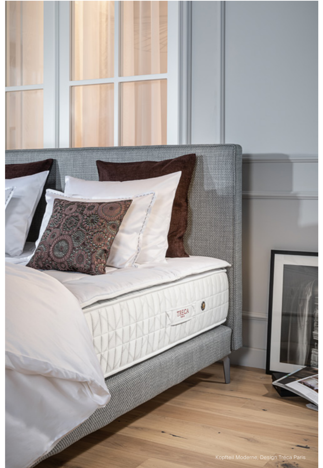
Kopfteil Moderne, Design Tréca Paris