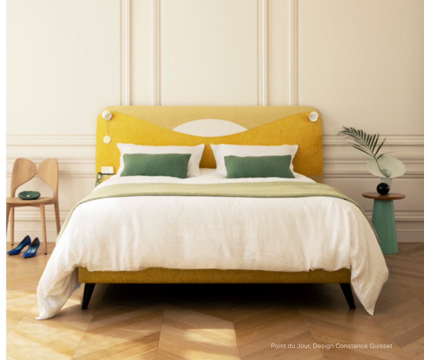
Point du Jour, Design Constance Guisset