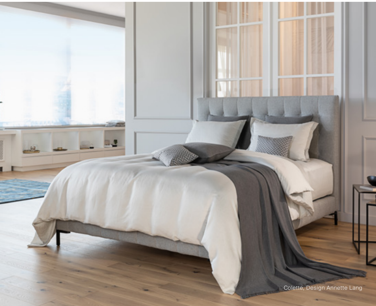
Colette, Design Annette Lang