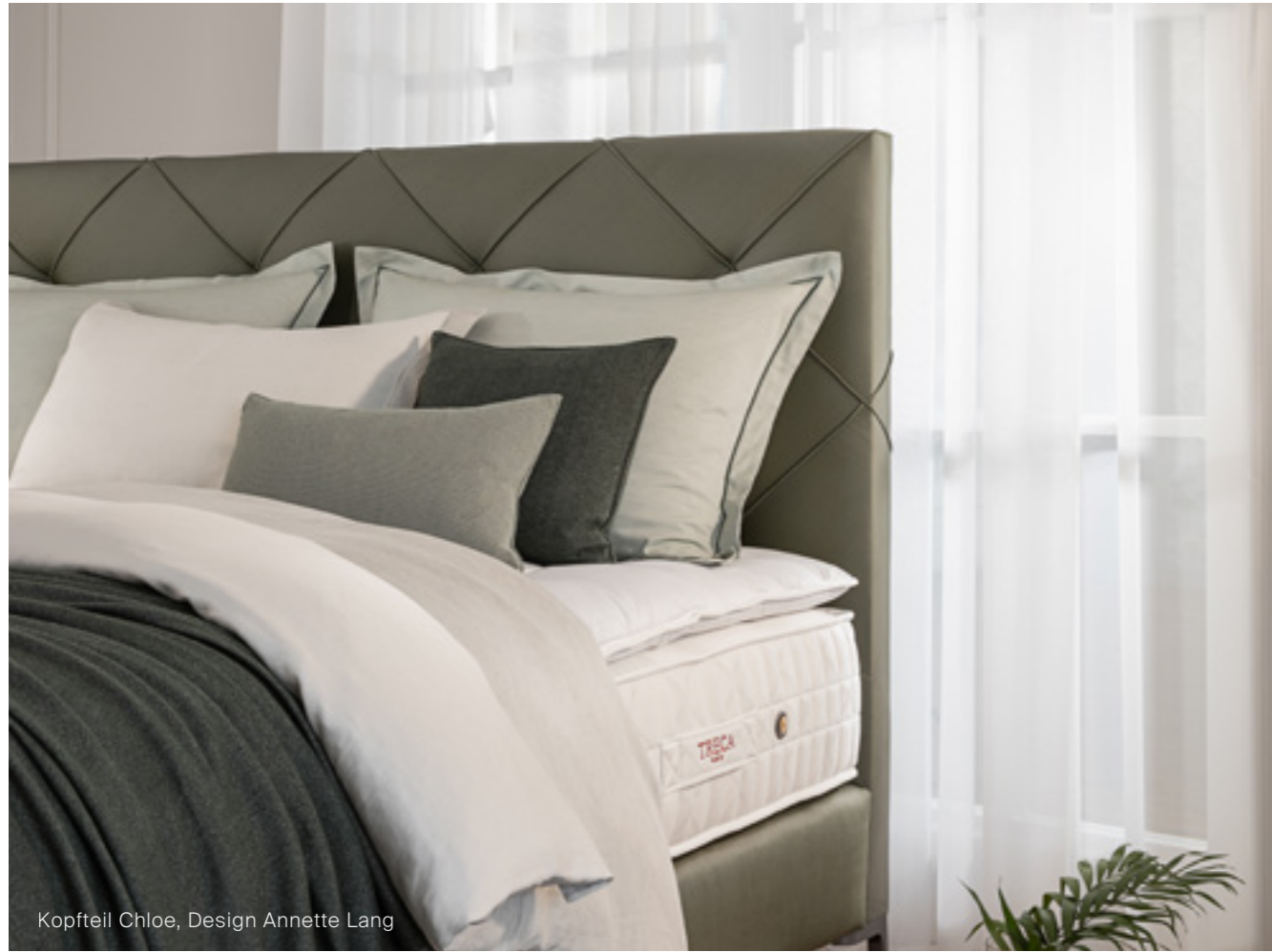
Kopfteil Chloe, Design Annette Lang