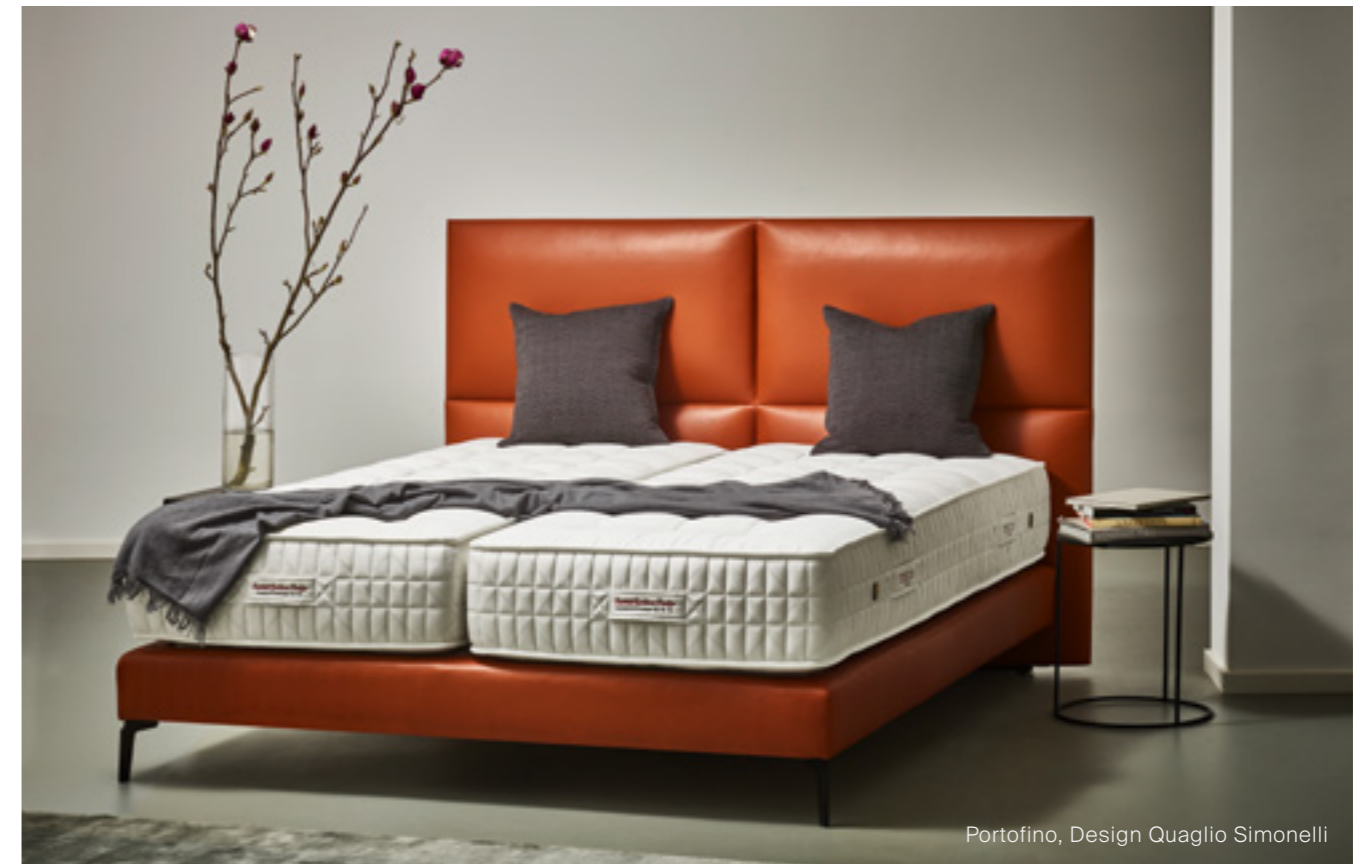
Portofino, Design Quaglio Simonelli

Bei Tréca spiegelt der Weg zu einem maßgeschneiderten Bett nicht nur das Engagement für die Erfüllung individueller Bedürfnisse wider, sondern zeigt auch unser Know-how in der Verarbeitung von hochwertigem Leder, das dafür sorgt, dass jedes Element Ihres Bettes Luxus und Raffinesse ausstrahlt.